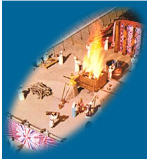
L'autel des holocaustes (avec le feu : symbole du jugement)