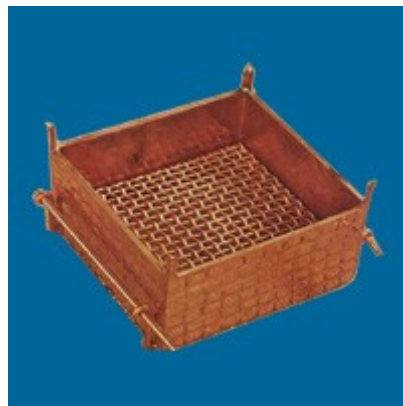
L'autel des holocaustes, la grille d'airain et les quatre cornes